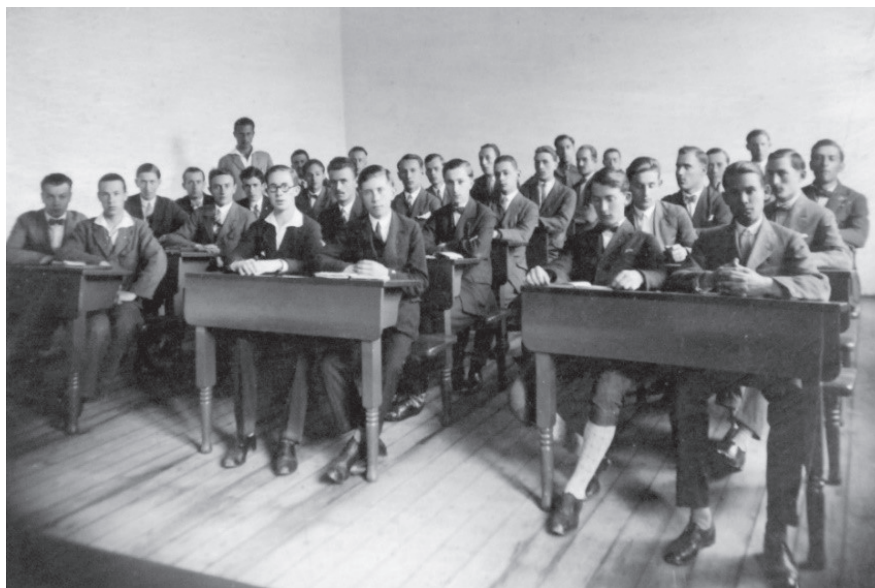
2. kép: Tanítójelöltek a szenttamási időkből

Az első – és akkor egyetlen – lány tizenkilenc évvel később, 1861-ben levelező tagozatosként kapta meg diplomáját, a következő női hallgató tíz évvel később végzett. Csak az első világháború után kezdtek fokozatosan felvenni lányokat is. A képzés kezdetben tíz hónapig tartott, de három évvel később a királyi mesterképzőkhöz hasonlóan két évre bővítették.