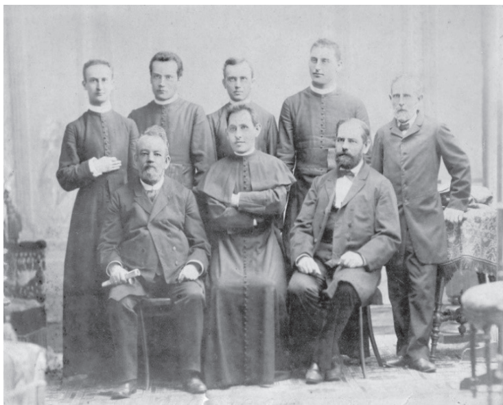
3. kép: Tanári kar az 1860-as években

Fordulópontot jelentett a népoktatásban és a tanítóképzésben az Eötvös József nevéhez fűződő törvény. Az 1868. évi XXXVIII. törvénycikk a népoktatásról a VII. fejezetben tárgyalja a tanítóképezdét: