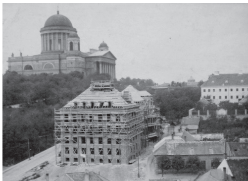
4. kép: Az új épület építése

Az öt évfolyam elhelyezésére a meglévő épületben alig volt lehetőség, így szükségessé vált a régóta tervezett új épület megépítése. Az érseki pedagógiai intézet épületét 1929. november 8-án szentelte fel a hercegprímás, a későbbi ünnepélyes megnyitón Klebelsberg Kunó kultuszminiszter is részt vett. A három díszes bejárat közül az első az intézetbe, a középső a díszteremhez, az alsó az internátusba vezetett. Az épületen 1959-ben végeztek nagyobb lélegzetű átalakítást, cél a 150 férőhelyes tanítóképző intézet, 10 osztályos gyakorlóiskola és 100 férőhelyes leány diákotthon kialakítása volt (Müllerné, 1991, 59). A tanítóképzés a mai napig ebben az épületben folyik (4. és 5. kép).