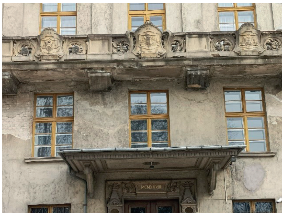
1. kép: Az épület homlokzatán található címerek

A reformkori országgyűlések oktatásüggyel foglalkozó bizottságai korszerű, előremutató megoldási javaslatokat tettek a „magyar preparandiákra” vonatkozóan, ám ezek elfogadására nem került sor. Ezzel ellentétben az egyházi kezdeményezések sikereseknek bizonyultak. 1818-ban Szepesváralján létesült az első, német nyelvű, majd 1828-ban Egerben az első magyar nyelvű katolikus tanítóképző. 1840-ben öt királyi katolikus tanítóképző létesült, 1847-ben pedig Győrött alapítottak egyházi (katolikus) képezdét.