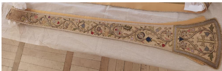
4. Stóla