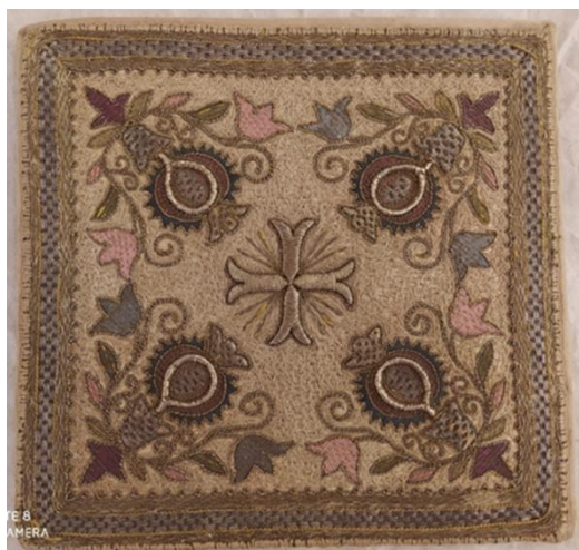
1. Palla