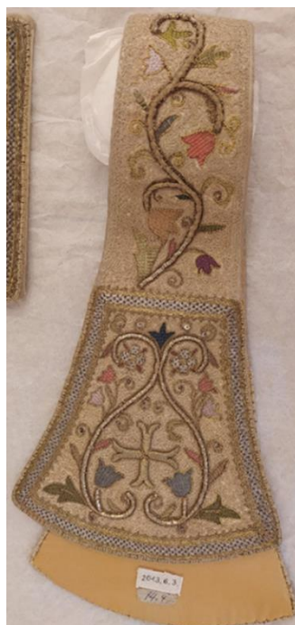
3. Manipulus