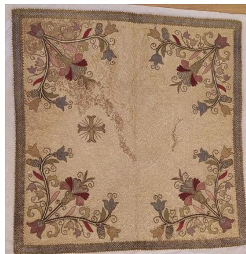
2. Kehelytakaró/velum (a szerző fényképe, 2021)