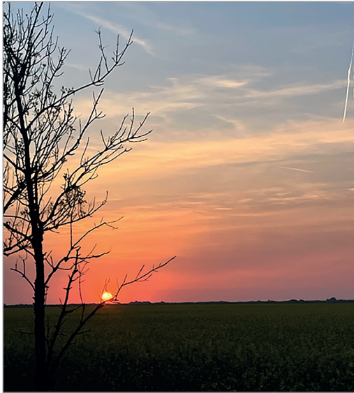
Kelet-csongrádi pusztai naplemente

Apám már nem érte meg a rendszerváltást. A földeket szétosztották, azokat javarészt azok a tsz-vezetők szerezték meg, akik addig is gazdálkodtak rajta. Az igazság az, hogy ők azoknak a nagyobb gazdáknak a gyermekei, unokái voltak, akik, miután apjuk belépett a tsz-be, továbbtanulhattak, agráregyetemekre járhattak. Ők értettek a mezőgazdasághoz. Amikor lehetett, nagyapáim Szentés környéki földjét mi is kikértük a téesz területéből, de nem igen tudtunk mit kezdeni vele más irányú értelmiségi foglalkozásunk miatt. Később eladtuk a legnagyobb akkori gazdának, aki ugyanaz a téeszelnök volt, mint aki 30 éve kiadta a földet. (Bár most már jobboldalon állt.)