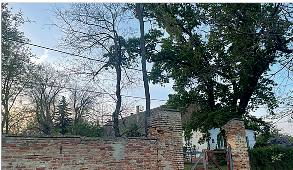
A téglafallal körbevett egykori településközpont Székkutason