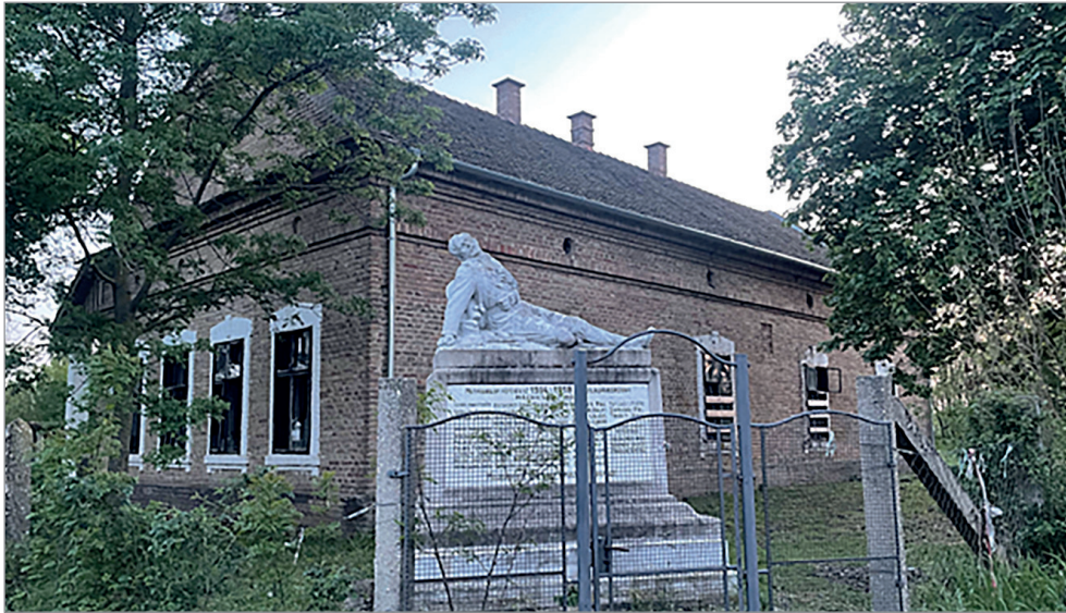
Az I. világháborús emlékmű Mátyásréten

és mi is kérdeztük, hogyan volt régen. Lassan-lassan megszoktak, elfogadtak az ottani lakosok is bennünket.” 14