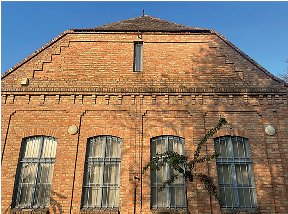
A sósalmi tanyasi iskola épülete

1948-ban felszámolták, mivel az új államhatalom nem tűrte az önszerveződő kulturális intézményeket.