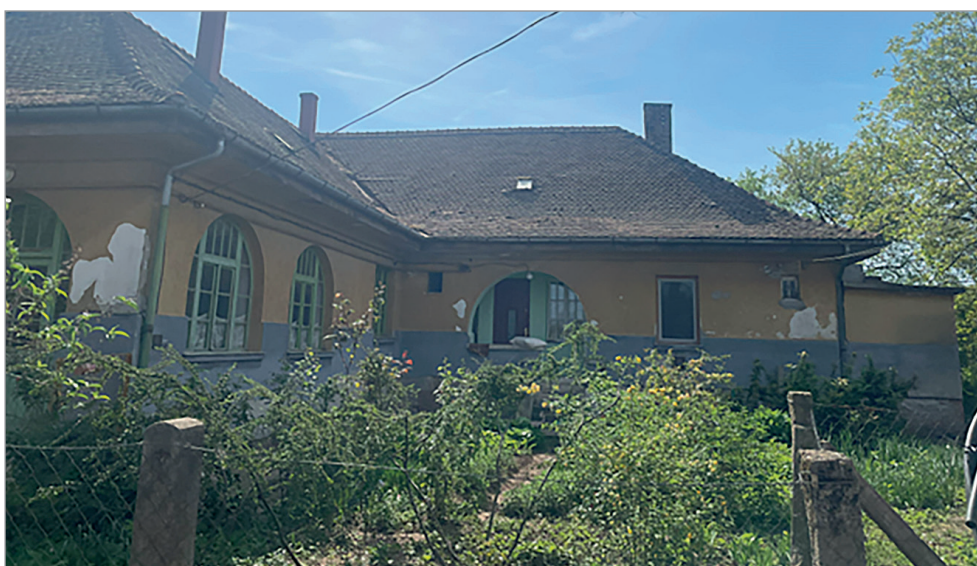
Az egykori székkutasi tanyai iskola épülete

Magyarországon, és Vásárhelykutason (Székkutason) a 19–20. század fordulóján ültették végig vele az útmentét a vasútállomástól a templomig. Minden tanyai iskolában kötelező volt artézi kutat fúratni, hogy legyen a gyerekeknek és a környéknek egészséges ivóvize.