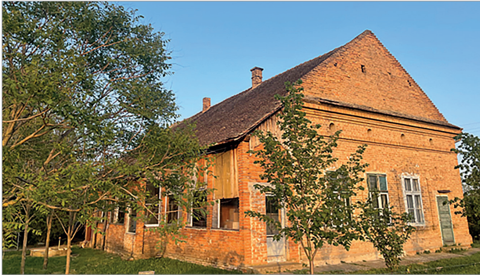
Az egykori csicsatéri tanyasi iskola épülete