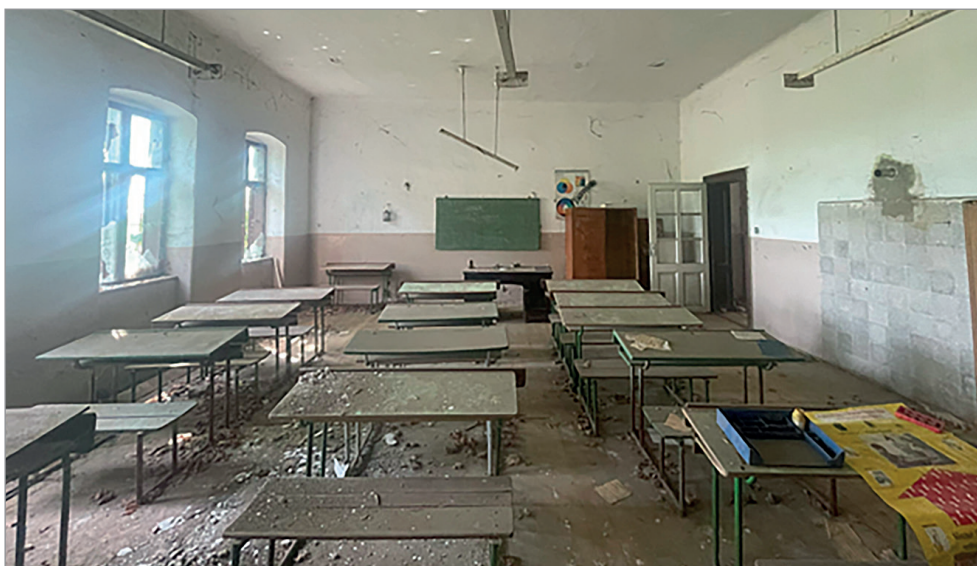
Az egykori mátyáshalmi tanyasi iskola belső tere

rosszindulatúan zaklatta a „bedusokat”, a pedagógusokat, ahogyan ő ki tudta mondani ezt a szót.