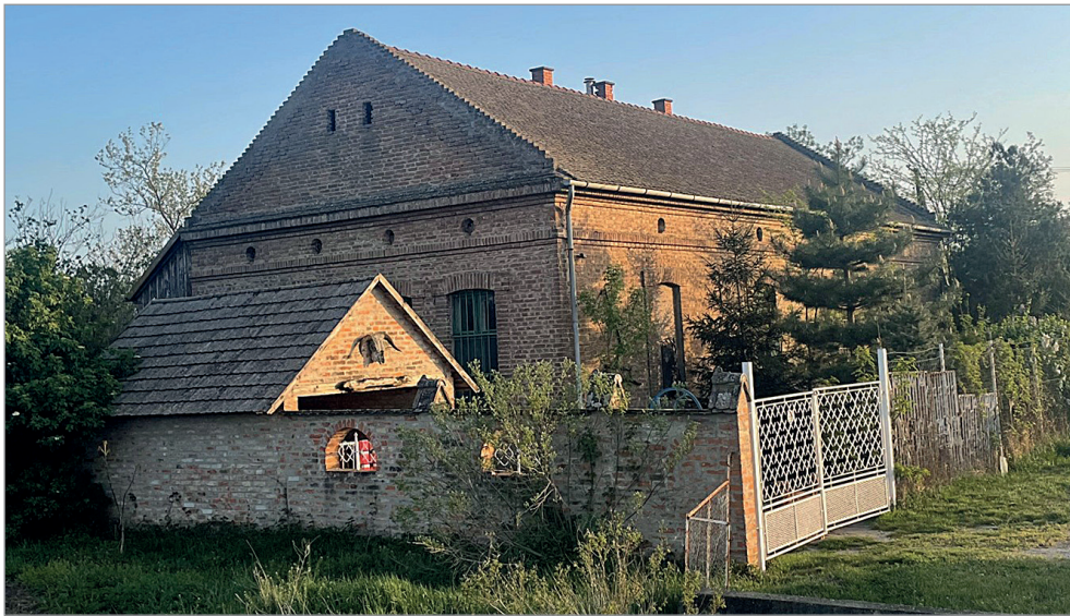
Egykori tanyai iskola Szőkehalmon

ben fekvő Csengelére akarták helyezni, de a mindig intézkedő nagyanyám két kacska élete árán, amit felpucolva szállított az ügyintézőnőnek, elérte, hogy a Szentesi járásban maradhassanak.)