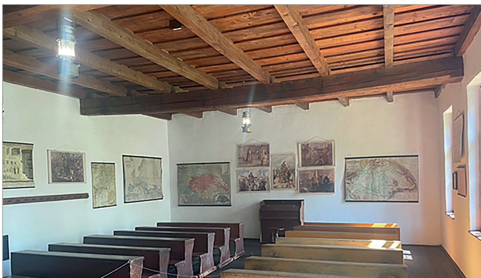
Az Ópusztaszeri Nemzeti Történelmi Emlékpark Szabadtéri Néprajzi Múzeum tanyasi iskolabelsője

holdnyi illetményföld. Ezen termelhetett jószágainak kukoricát vagy éppen eladásra cirkot az orosházi seprűgyárnak. Az 1970-es évektől a sláger a fűszerpaprika volt, amelyet a Szegedi Paprikafeldolgozó vett meg októberben a szedés után.