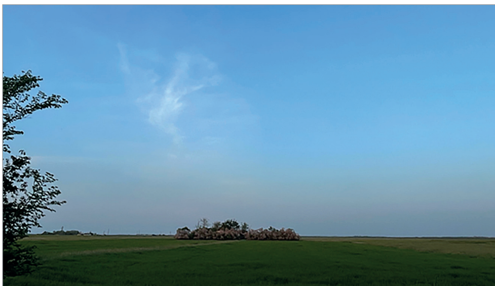
Pusztai táj a székkutasi tanyavilágból

profiljába kellett őket illeszteni. Mindez nagyon sok nehézséggel és gyakran emberi konfliktussal járt.