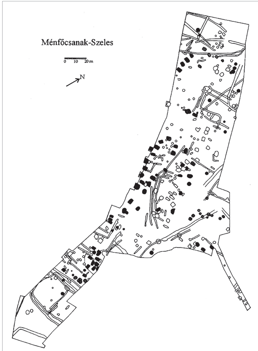
2. ábra. A ménfőcsanak-szeles-dűlői feltárás összesítő alaprajza. A korai Árpád-kori települési fázisba tartozó telepjelenségek „fehérek” (belső területük kitöltetlen). SZÖNYI 2005: 1. térkép.

Alább az ilyen estekkel fogunk részletesebben foglalkozni, azonnal kiemelve, hogy a superpozíciók ilyen, első ránézésre bonyolultabb és kaotikusabb típusa az utóbbi évtizedek számos további feltárásán is megfigyelhető volt. 10