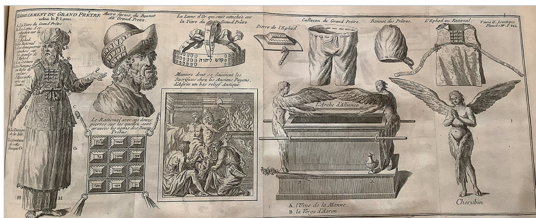
1. kép. Calmet, Augustin: Sainte Bible en latin et en françois (Paris: Antoine Boudet, 1767)

A Szentek Szentjében helyezték el a 135 cm hosszú, 67,5 cm széles és 67,5 cm magas, akác-fából ( šitîm ) készített szövetség ládáját (Kiv 25,10). 12 A faanyagot kívül-belül arannyal borították, ahogy a két akácfa rudat is bevonták vele, ezek segítségével hordozták a leviták a ládát. A láda szegélye színaranyból készült, ugyanígy a lábakra erősített négy öntött karika is. A láda tetején a 135 cm hosszú és 67,5 cm széles „engesztelés tábláját” ( kapporet ) ugyancsak tiszta aranyból munkálták ki. 13 Ennek két végén állt arccal egymás felé fordítva az a két, valószínűleg olajfából faragott kerub, amelyek felületére domborítással vitték fel az aranylemezt, hasonló technikai megoldással a salamoni templom olajfából készített és arannyal bevont angyalaihoz. A frigyláda kerubjai kiterjesztett szárnyaikkal befödtek az engesztelés tábláját, és szemeket is reá szegeztek. Ez a hely a legfontosabb Mózes és Izrael fiai számára, miután az Örökkévaló ígérete szerint „Ott fogok veled találkozni, s a törvény ládáján álló két kerub 14 között, az engesztelés táblájáról ( kapporet ) 15 közlöm veled mindazt, amit általad Izrael fiainak mondani akarok” (Kiv 25,22).