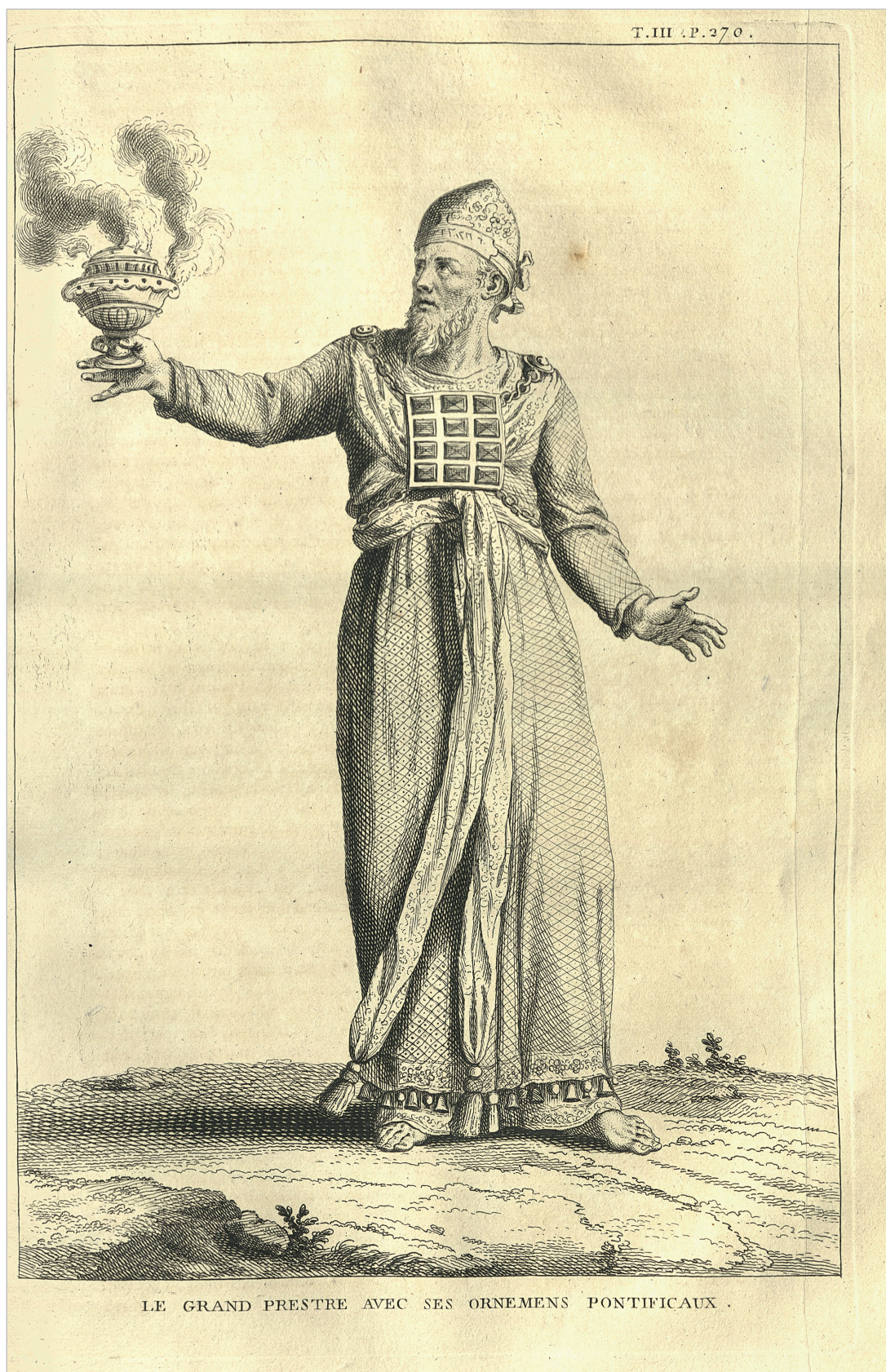
3. kép. Calmet, Augustin: Dictionnaire Historique, Critique, Chronologique, Geographique et litteral de la Bible... (Paris: Emery, 1730)